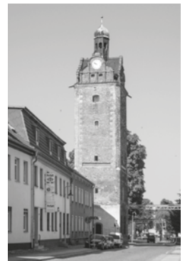
Hallischer Turm, westlicher Torturm der Stadt