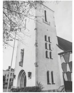
Katholische Pfarrkirche in Delitzsch